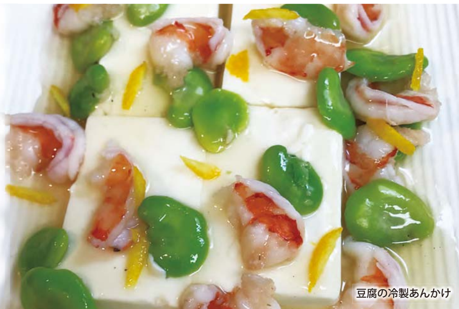
豆腐の冷製あんかけ