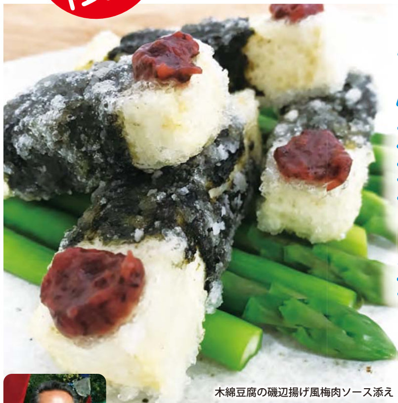
木綿豆腐の磯辺揚げ風梅肉ソース添え