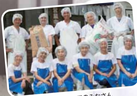
豆彦のスタッフのみなさん