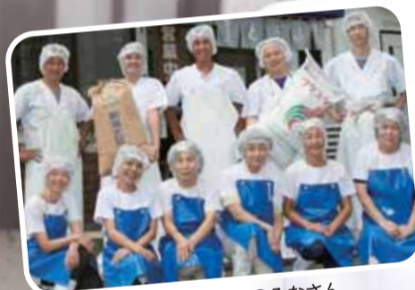
豆彦のスタッフのみなさん