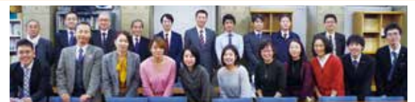
さんえすクラブ会員一同(2017.さんえすまつり参加者)